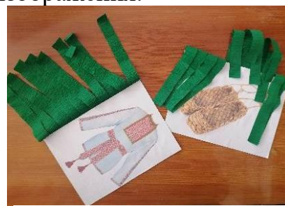
Рис.1. Упражнение «Ветерок»

Назови, что это? Верно, это мордовская мужская рубаха (панар). Ворот и разрез на груди панара отделан вышивкой, цветным тканым узором, блёстками. Застёгивается на крючки, пуговицы или скрепляется завязками. Носили панар навыпуск с узким поясом или ремнём.