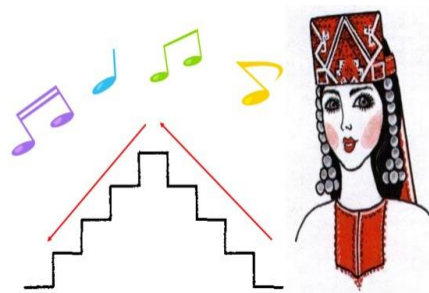
Рис.3. Упражнение «Звонкая песенка»

Цель: закрепление правильного произношения изолированного звука [Ш] (звук можно заменить другим автоматизируемым звуком).