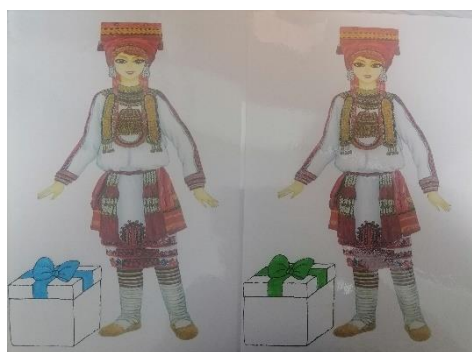
Рис.5. Игра «Дарим подарки»

Ход: ребёнок называет слова, определяет звук в слове и раскладывает картинки.