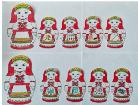
Рис.6. Игра «Мамы и дочери»

Художественное слово. Посмотри это мордовские матрёшки. Мордовская матрёшка – это деревянная игрушка, которая отражает национальные особенности мордовской одежды, основные цвета и элементы национальной росписи. Особенности мордовской матрёшки в том, что она удлинённой формы, одета в мордовский народный костюм: головной убор – панго, мордовскую рубаху — панар, узор на мордовской матрёшке – геометрический в основном с использованием трёх цветов: красного, чёрного, белого и основных элементов мордовского орнамента: галочка, ромб, крест, ёлочка.