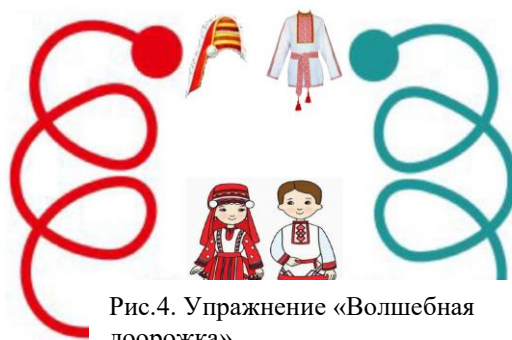
Рис.4. Упражнение «Волшебная дорожка»

Так как у мордовочек свадьба, давай подарим им подарки: складывай на коробку с голубым бантиком картинки-подарки, в названиях которых есть звук [Р], а на коробку с зелёным бантиком – картинки-подарки, в названии которых звук [Л] (аналогично можно брать картинки с парами других дифференцируемых звуков).